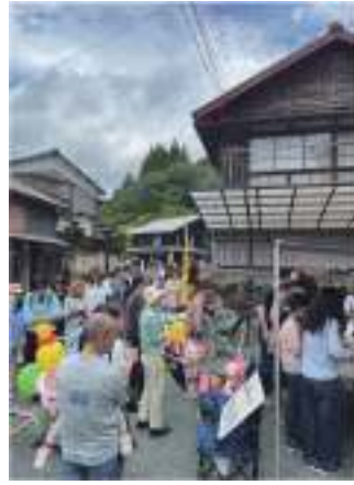
昨年のフェスの様子。山間の町に多くの人を訪れ、活況を呈した。